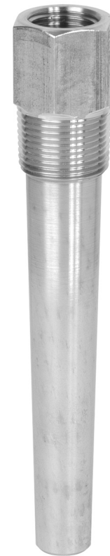
Vaina para enroscar modelo TW15-H