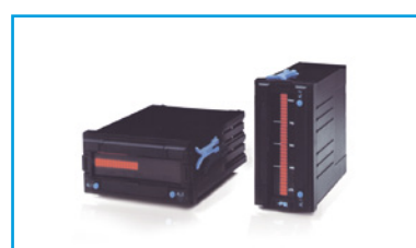
Indicadores de barra