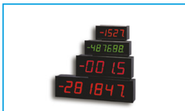
Indicación de Gran Formato