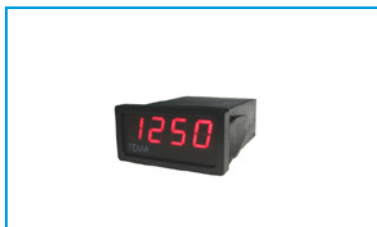
Indicadores de Panel Miniatura 48x24mm