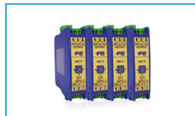
Convertidores de señal