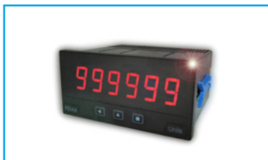
Indicadores de Panel Standard 96x48mm