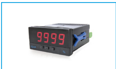
Indicadores de Panel Compactos 72x36mm