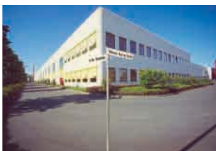
Espelkamp / Alemania - Fábrica 2