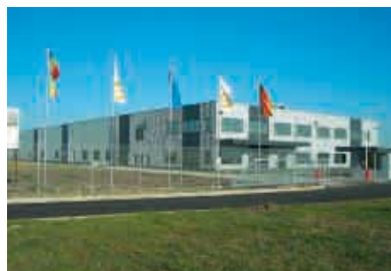
Sibiu / Rumania