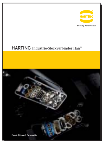
Conectores industriales Han®