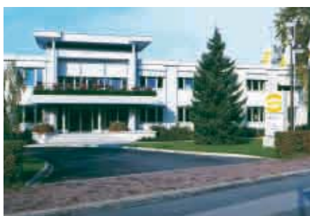
Espelkamp / Alemania - Fábrica 4