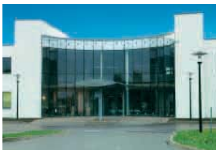
Espelkamp / Alemania - Fábrica 5