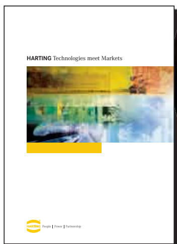
Folleto de aplicaciones