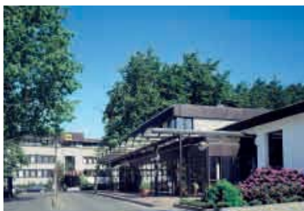
Espelkamp / Alemania - Fábrica 1