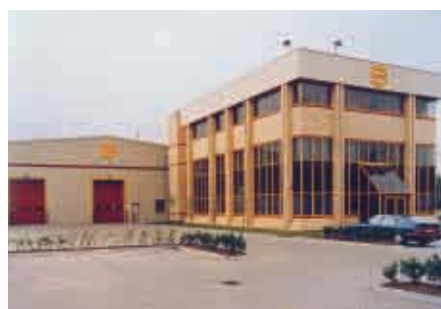
Northampton / Reino Unido