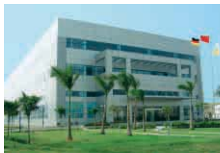
Zhuhai / China

Knud Wexøe A/S Skaettekaeret 11, P.O. Box 152 DK-2840 Holte Phone +4545465800 Fax +4545465801 E-Mail: wexoe@wexoe.dk Internet: www.wexoe.dk