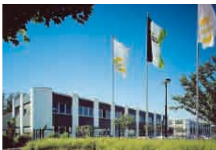
Espelkamp / Alemania - Fábrica 3