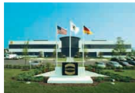
Elgin / USA