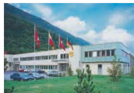
Biel / Suiza

MIGVAN Technologies & Engineering Ltd. 13 Hashiloh St., P.O.Box 7022 IL – Petach Tikva 49170 Phone +972 3 9240784 Fax +972 3 9240787 E-Mail: info@mte.co.il Internet: www.mte.co.il