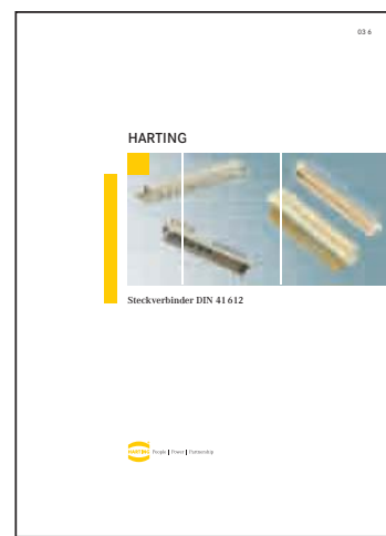
Conectores DIN 41 612