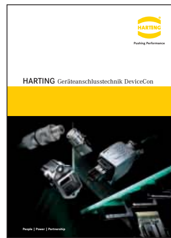
Device Connectivity DeviceCon