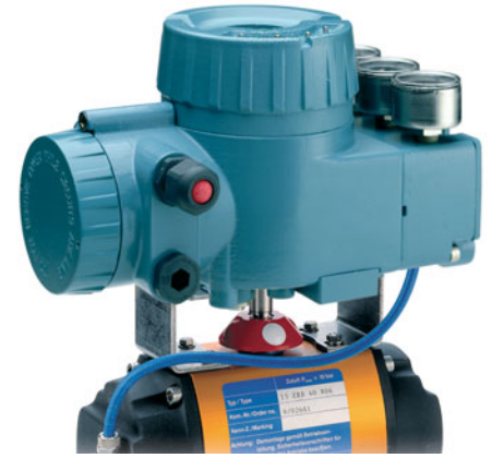
Ejemplo de montaje sobre actuador rotativo.