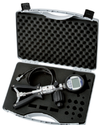
Equipamiento básico incl. generación de presión neumática

Maletín de calibración con manómetro digital modelo CPG500 y bomba de prueba manual modelo CPP40 para medir la magnitud presión, -0,95 ... +40 bar, compuesto por: