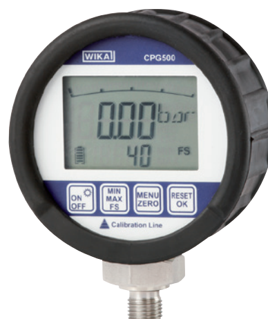
Manómetro digital modelo CPG500

Con una frecuencia de 100 mediciones por segundo, el CPG500 ofrece una enorme velocidad de medición. De esa manera pueden registrarse picos y caídas de presión de elevada velocidad. El indicador gráfico de barras integrado en la pantalla, con función de indicador de seguimiento y valores picos MÍN/MÁX, permite un análisis efectivo del punto de medición.