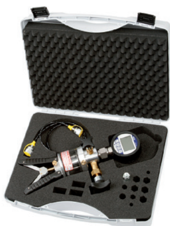
Equipamiento básico incl. generación de presión hidráulica

Rangos de medida disponibles véase los datos técnicos