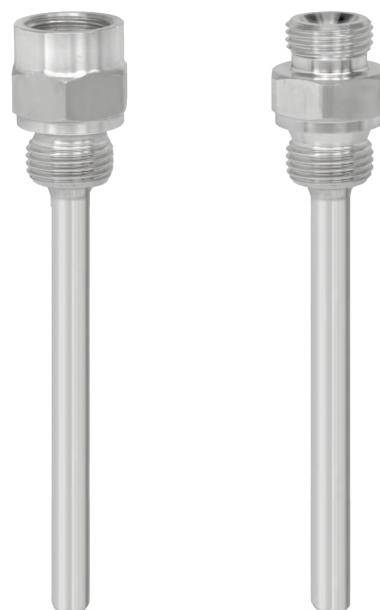
Vaina para enroscar Fig. izquierda: modelo TW45-F Fig. derecha: modelo TW45-G