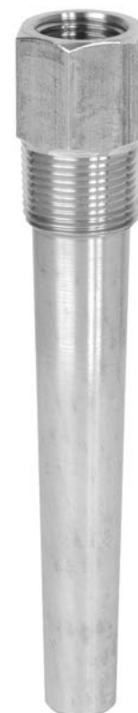
Vaina para enroscar modelo TW15-H