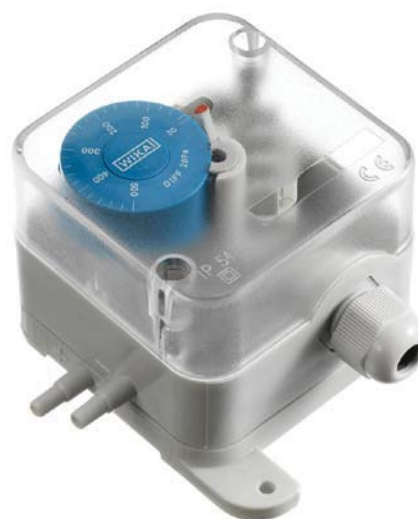
Interruptor de presión diferencial air2guide S Tipo A2G-40