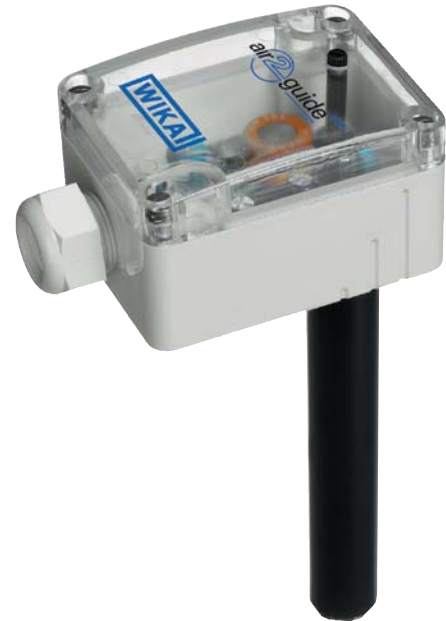
Sensor de calidad del aire air2guide VOC Modelo A2G-80