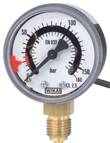
switchGAUGE modelo PGS10